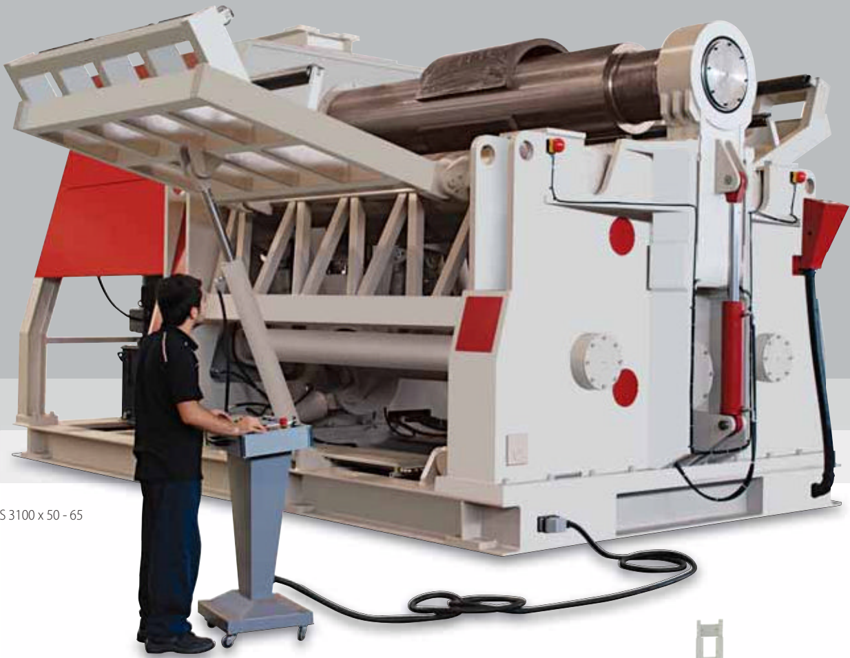
• AHS 3100 x 50 - 65