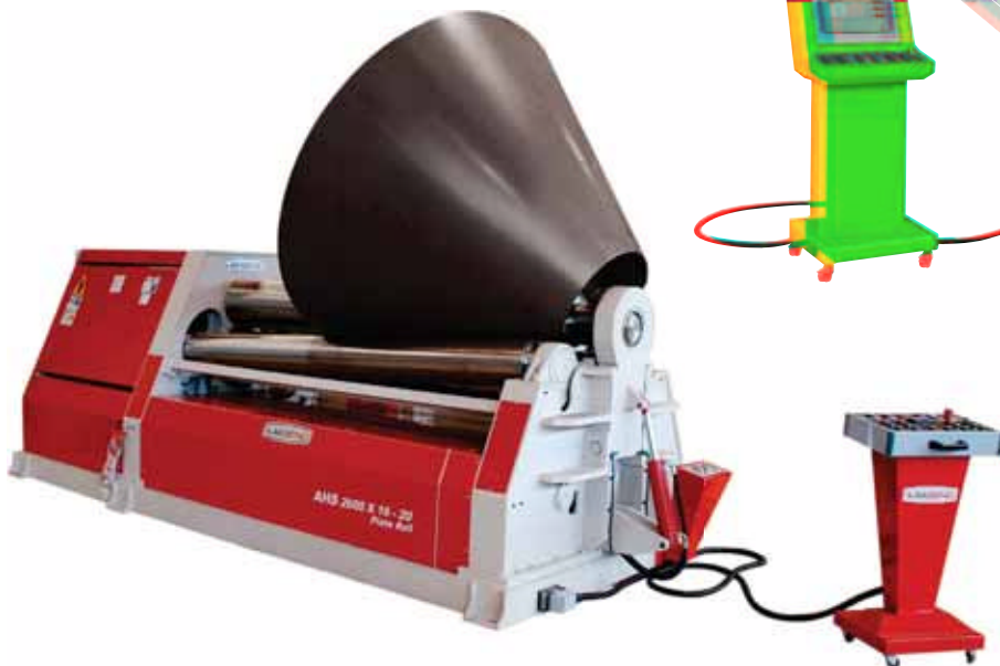
• AHS 2600 x 16 - 20