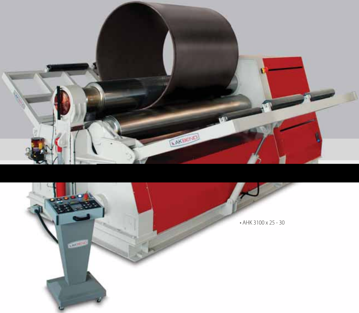
• AHK 3100 x 25 - 30

Akyapak, 2 mm. den, 170 mm.'e kadar sac kalınlığında ve 1000 mm'den 6000 mm ye kadar sac genişliğinde olmak üzere 3 valsli hidrolik silindir makineleri üretmektedir. Makinelerimiz valsleri hidrolik tahrikli olup yan valsler hidrolik olarak aşağı yukarı hareket ettirilir. 3 Vals mili üç ayrı hidrolik motor ve / veya redüktör ile tahriklidir. ( vals ø 230 mm. makine ve üstü) Üst vals mili kapağını açma ve kapama, üst milin otomatik olarak yukarı kalkma işlemi kumanda paneli üzerinden kolayca gerçekleştirme özelliğine sahiptir.