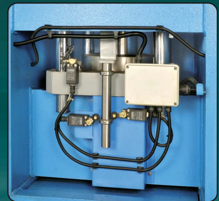
Premilamiera, Serre-tôle, Blank-holder, Blechhalter, Cojín